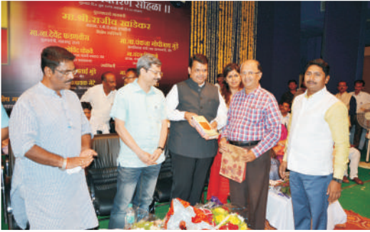
मुख्यमंत्र्यांच्या हस्ते पुस्तकाचे प्रकाशन