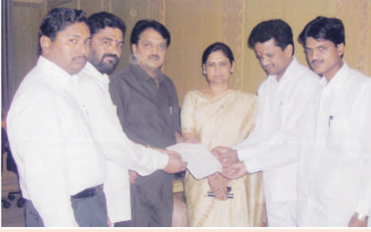
पहिल्या पुरस्कार वितरण सोहळ्याचे मुख्यमंत्र्यांना निमंत्रण