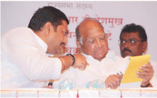
खा.शरद पवार यांच्या समवेत धनंजय मुंडे