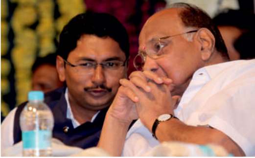
रा.काँ. चे अध्यक्ष शरद पवार यांच्या समवेत वसंत मुंडे