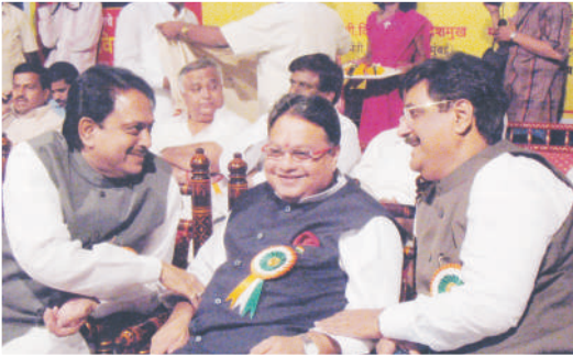
विलासराव-गोपीनाथराव यांच्यातील दिलखुलास चर्चा