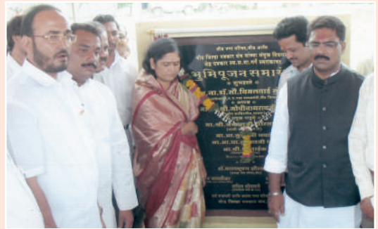
स.मा.गर्गे स्मारकाचा भूमिपूजन समारंभ