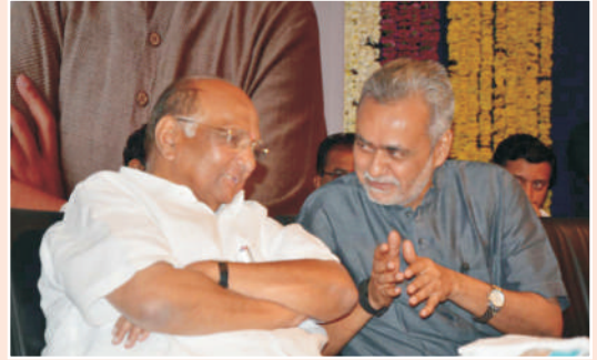
शरद पवार आणि गिरीश कुबेर